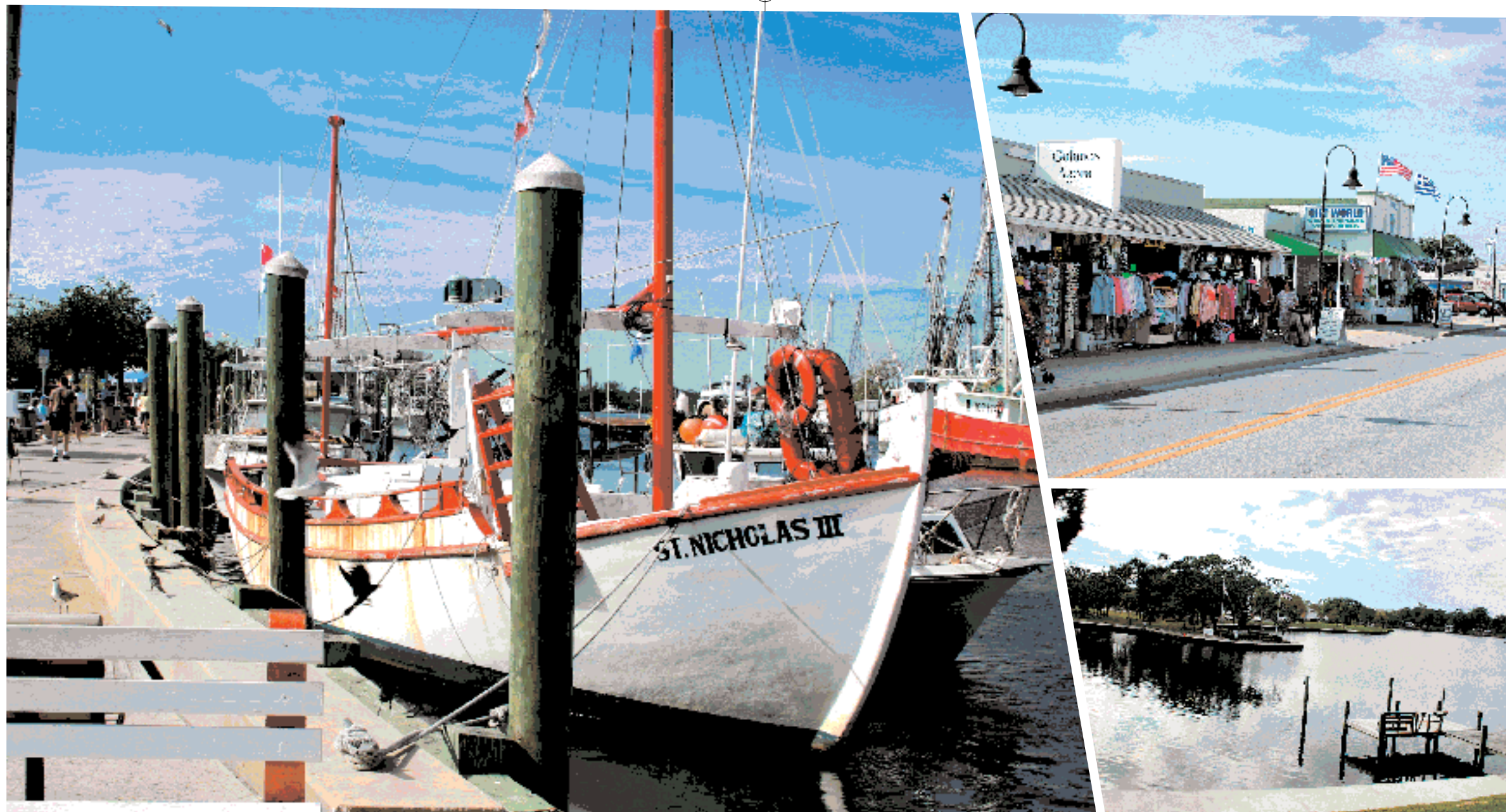
Η οδός Δωδεκανήσου αποτελεί τον παραλιακό δρόμο του Tarpon Springs και ουσιαστικά το κέντρο όπου διεξάγεται εδώ και 100 χρόνια όλη η εμπορική δραστηριότητα της πόλης. Στις μέρες μας με τον τουρισμό, παλιότερα με το εμπόριο των σφουγγαριών.

Μια μικρή Ελλάδα, ένα ελληνικό χωριό ακμάζει εδώ και εκατό χρόνια στις δυτικές ακτές της πολιτείας της Φλόριντα. Με άρωμα και γεύση Μεσογείου, η κοινότητα του Tarpon Springs, μέσα από εικόνες που έχουν γίνει γνωστές διεθνώς σε όσους έχουν δει την κινηματογραφική ταινία «Κάτω από τον ύφαλο των 12 μιλίων», είναι στενά συνδεδεμένη με τη ναυτική παράδοση του λαού μας και το μόχθο της θάλασσας.